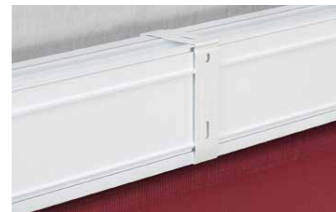
► Montageclip für die Wand- oder Deckenbefestigung

Die neu gestaltete Rundkassette ist für VarioRollos in zwei Baugrößen verfügbar. Hierdurch bleibt die einheitliche Formensprache mit stimmigen Proportionen gewahrt und es können Anlagengrößen von bis zu max. 240 cm Breite realisiert werden. Die gerade Rückseite sorgt für einen bündigen Wandanschluß und ermöglicht eine unsichtbare Befestigung über die verschiebbaren Montageclips. Je nach Befestigungswunsch an Wand oder Decke stehen zwei verschiedene Clips zur Verfügung.