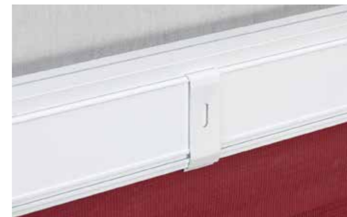
► Montageclip für die Wand- oder Deckenbefestigung